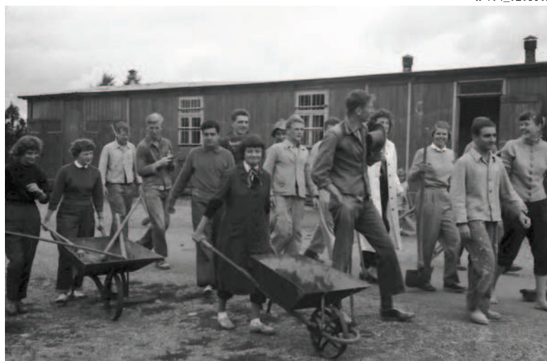
Studentenaktion im Flüchtlingslager

Die Ergebnisse könnt ihr bei einer Abschlussveranstaltung einem interessierten Publikum präsentieren: ob als Vortrag, Film, auf einer Stellwand oder als Hörspiel. Der Kreativität sind keine Grenzen gesetzt.